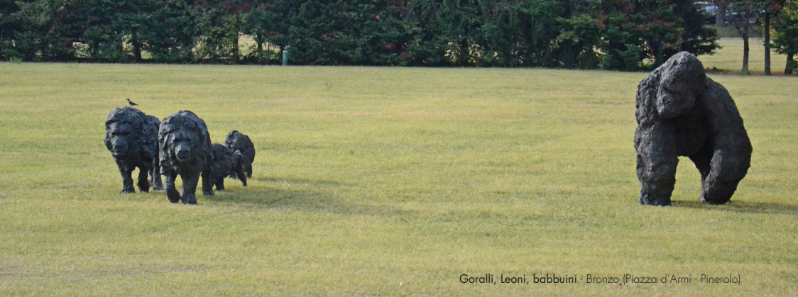
Goralli, Leoni, babbuini - Bronzo (Piazza d'Armi - Pinerolo)